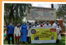
Freude über ein Röntgengerät und Coronaschutz in Uganda

Im Lauf der Jahre konnte die Ausstattung mehrerer Krankenhäuser auf den Philippinen, aber auch in Nigeria, Uganda und Brasilien mit medizinischen Geräten wie z.B. Dialyse und Röntgengeräten, OP-Tischen und Kinderbetten verbessert werden.